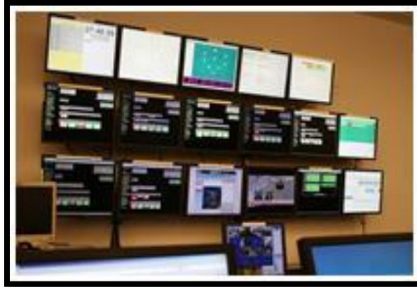
Gambar 1. Network Monitoring System (NMS)

Dalam lanjutan video ini, Narasumber juga menjelaskan mengenai Software Defined Network (SDN) dan platform layanan Cloud . SDN merupakan pengembangan lebih lanjut dari arsitektur jaringan tradisional. Dimana SDN ini memisahkan data Plane dan Control plane yang pada jaringan tradisional sebelumnya digabung. Pada arsitektur jaringan SDN seluruh data forwarding dikontrol secara terpusat oleh Control Plane yang dapat dilihat pada gambar 2.